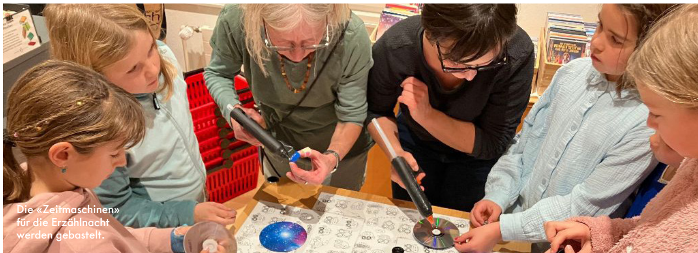
Die «Zeitmaschinen» für die Erzählacht werden gebastelt.